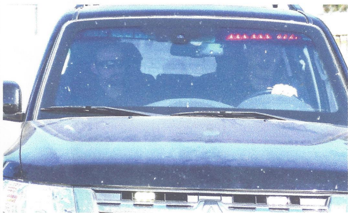
EX-PRESIDENTE DO BB e da Petrobras Aldemir Bendine foi preso nesta quinta (27), durante a Operação Cobra, 42ª fase da Lava Jato

gerou perdas de R$ 39 milhões aos fundos exclusivos da previdência dos funcionários. Também houve prejuízos de R$ 2 milhões à carteira própria do próprio fundo. As informações estariam no inquérito administrativo instaurado pela Comissão de Valores Mobiliários. Os 12 acusados vão responder por improbidade administrativa. A ação foi ajuizada pela 3ª Promotoria de Justiça de Tabela Coletiva de Defesa da Cidadania da Capital, na última nesta terça, 25.