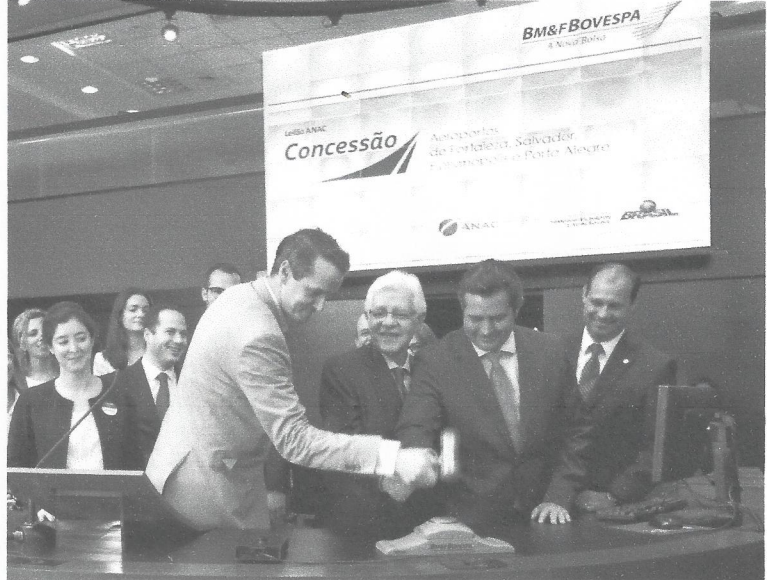
MINISTRO MOREIRA FRANCO em cerimônia de batida do martelo com os vencedores da concessão do aeroporto de Porto Alegre