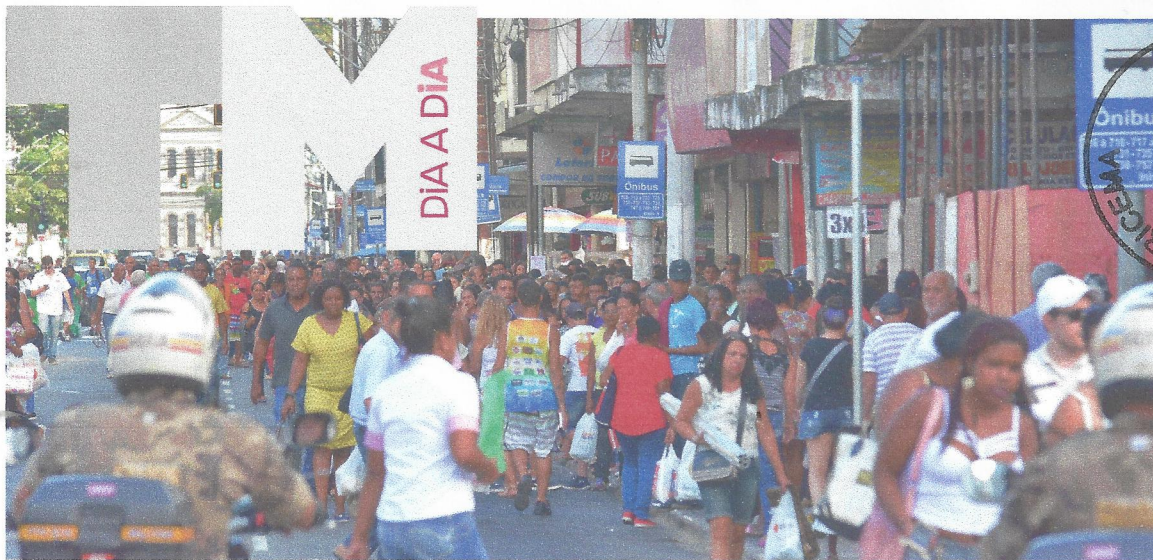
USUÁRIOS DE ônibus tiveram que se deslocar a pé durante a manifestação, que ocupou parte da pista de ônibus; maioria reclamou do horário do protesto, iniciado pouco depois das 16h