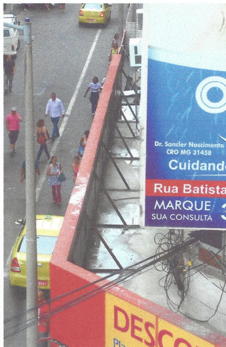
ÁGUA FICA parada em marquises, principalmente por conta de gotejamento de ar-condicionado, transformando-se em risco para a vizinhança

Em nota, a SAU informou que a lei nº 11.309 regulamenta a questão no município e estabelece critérios para conservação de elementos de fachadas em prédios, de responsabilidade dos proprietários das edificações. Um laudo técnico deve ser apresentado a cada três anos, e o não cumprimento da lei resulta em multa diária, cujo valor é pouco maior que R$ 50. No caso da instalação de um aparelho de ar-condicionado, o artigo décimo do Código de Posturas diz que é vedado destinar para vias e logradouros públicos resíduos líquidos dos aparelhos, implicando em infração no valor de R$ 731. Segundo a SAU, mais de dez notificações já foram emitidas neste ano.