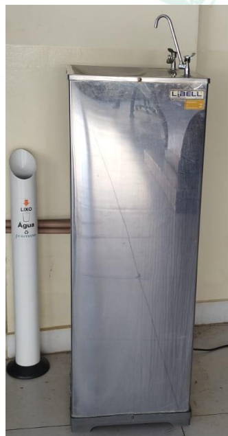
(Imagem 3 – Bebedouro LIBELL, modelo PGA)