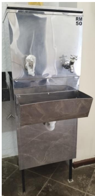
(Imagem 1 – Bebedouro inox RM 50)