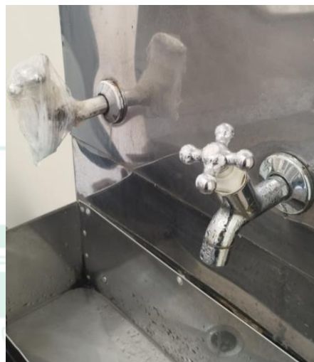
(Imagem 2 – Torneiras do bebedouro inox RM 50)