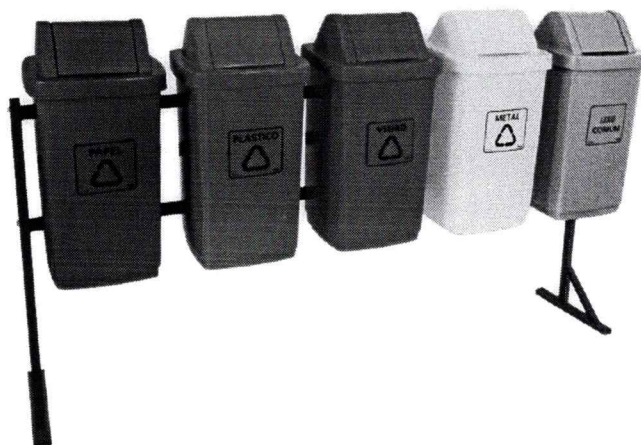
Modelo de lixeira a ser adotado na coleta seletiva de lixo